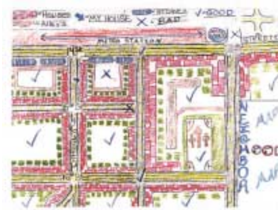
Figura 1: Mapa creado por Wilson Tobar, del proyecto Shaw EcoVillage en la ciudad de Washington, D.C.

Imagínate como la persona que hayas elegido y explora tu barrio desde su punto de vista. Explora una calle, una cuadra o varias cuadras. Llévate un mapa y mientras caminas—lentamente— haz una lista de aquellas cosas que te parecen buenas (pros) y de las que se podrían mejorar (contras) (ver figura 1). Si tienes suficiente tiempo, date otra vuelta o explora un segundo barrio y compáralo con tu notas. Una vez que hayas terminado tu lista, decide cuáles son los contras más importantes y selecciona el que tú creas que puedas cambiar. Acabas de dar el primer paso para hacer que tu comunidad sea más sostenible.